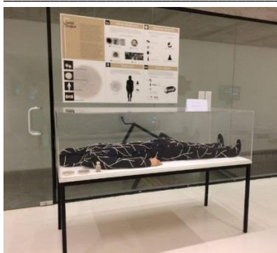
Figura 1: The Infinity Burial Project.

Para varios visitantes, la primera reacción fue de intriga y misterio. Para otros, la impresión fue de impacto: consideraron la obra “heavy” o “muy fuerte”. Algunos describieron la sensación de ver esta obra con el adjetivo “raro”, es decir, como extrañeza. Una entrevistada resaltó que observar la caja le dio una sensación de desconcierto e incomodidad. En una visita guiada con un grupo de estudiantes del 5° y 6° básico, niños y niñas se aglomeraron alrededor de la instalación, y, con las manos sobre la caja, observaron boquiabiertos “el cadáver”.