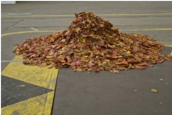
Figura 3: The Guide . Fuente: ¡ejemplos a seguir! [zne!]

Otra vez, muchos visitantes describieron su reacción frente a la obra en movimiento con las sensaciones de asombro y sorpresa. Una entrevistada llega a explicar, mediante muchas risas, que su asombro fue acompañado de la sensación de alerta y expectación frente la imaginada posibilidad de que “una persona de repente iba a salir” de las hojas.