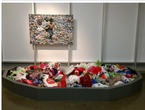
Figura 4: Greenbag Movement.

Entre el público de la muestra en Valparaíso, muchos comentaron la obra describiendo emociones conectadas a tristeza. Como ejemplifica un encuestado, al justificar por qué la obra le llamó tanto la atención: “Me sorprende del poco uso que le damos [al plástico] y no pensamos en el daño que hará desecharlas. Mil años en degradarse me pareció impresionante, me deprimió un poco”. Como él, muchos visitantes de la exposición encontraron la obra muy llamativa a primera vista y, al acercarse y leer la información sobre la desproporción entre los diferentes tiempos respecto producción, uso y descomposición del plástico, experimentaron primero asombro, luego malestar. Para muchos receptores, la imagen del niño además les causó una sensación de angustia o sentimiento de desesperanza.