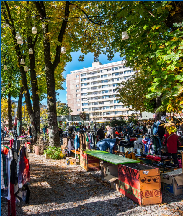
Der Grünsplatz ist ein Ort für alle.