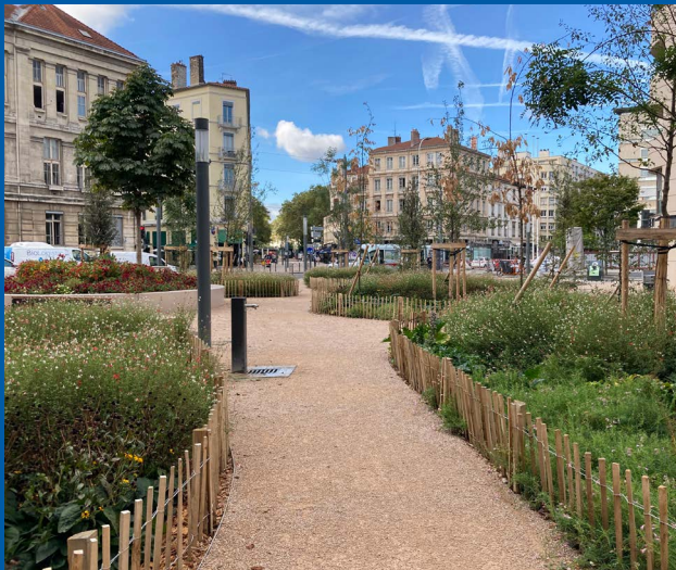
Die Promenade Moncey in Lyon wurde umgestaltet, vor allem um Fußgänger:innen mehr Komfort und Sicherheit zu bieten.

Um die kommunalen Gestaltungsmöglichkeiten zu stärken, sollte die Ausübung des Vorkaufsrechts für die Schaffung und Bevorratung von Frei- und Grünflächen erleichtert und auch unabhängig von Entwicklungsvorhaben ermöglicht werden. In Frankreich räumt die Loi visant à faciliter la mise en œuvre des objectifs de lutte contre l'artificialisation des sols et à renforcer l'accompagnement des élus locaux (deutsch: Gesetz zur Unterstützung lokaler Mandatsträger:innen beim Kampf gegen die Bodenversiegelung ) Kommunen seit Juli 2023 ein Vorkaufsrecht zum Erhalt bestehender Grün- und Potenzialflächen zur Renaturierung ein.