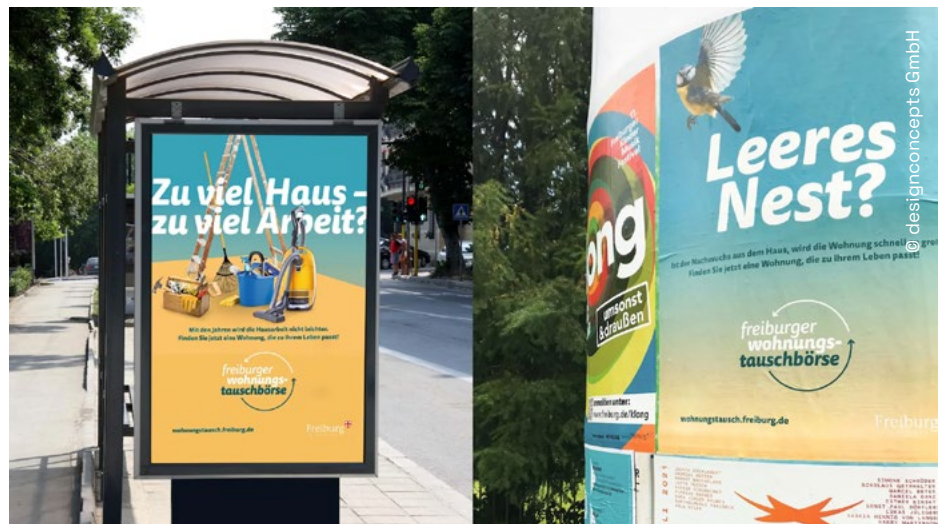
Affiche publicitaire de la bourse d'échange de logement de Fribourg

La consommation finale du secteur résidentiel est assez stable depuis 10 ans. Les effets à la baisse de l'amélioration de l'efficacité énergétique des nouveaux bâtiments et de la rénovation des bâtiments existants sont contrebalancés par l'augmentation du nombre d'habitations occupées 1 .