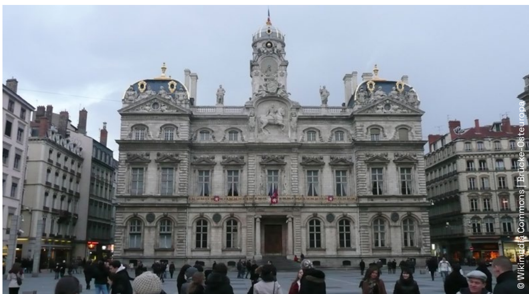
L'Hôtel de Ville de Lyon. La collectivité s'est dotée d'un plan de sobriété.